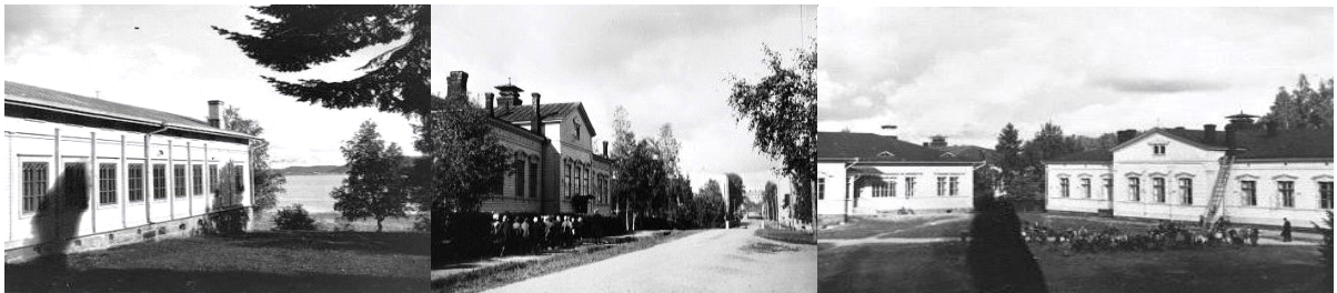
Kymölässä seminaarin miesopiskelijoiden käsityöhuone 1930–1939. Tyttöjen harjoittelukoulu 1930-luvulla. Seminaarin harjoittelukouluja.