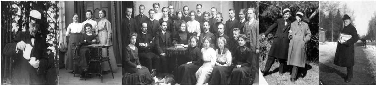
Seminaarin opettaja kevätpäivänä kahvilla. Naisoppilaita ryhmäkuvassa 1900-luvun alussa. Seminaarilaisia ryhmäkuvassa vuonna 1870. Iloisia hospitantteja 1920-luvulla. Seminaarin johtaja (1907–1928) Oskar Relander seminaarin tiellä.