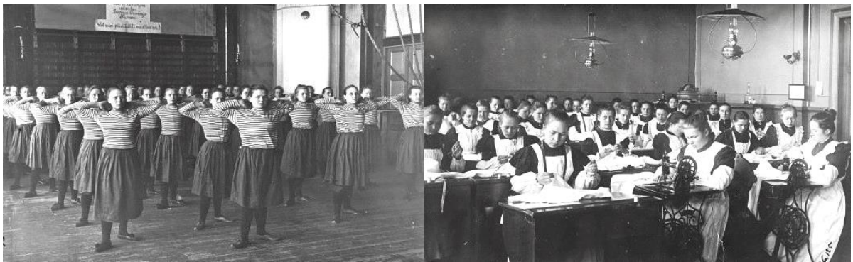
Sortavalan seminaarissa naisopiskelijoiden voimistelutunti 1900–1929. Naisopiskelijoiden käsityön oppitunti.