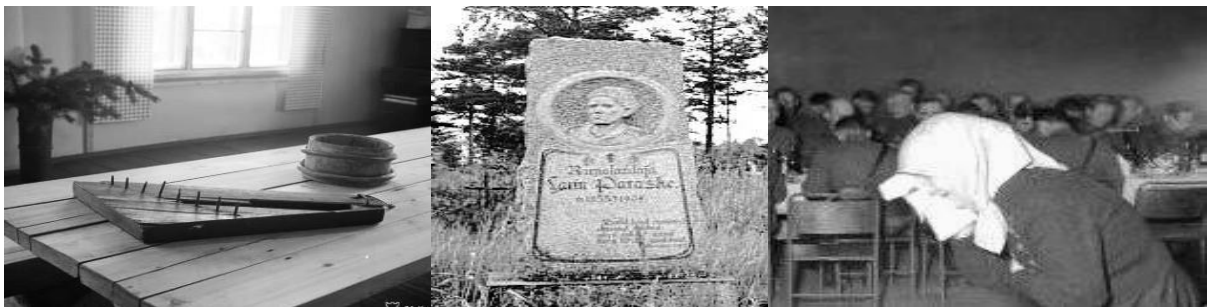
Kantele kenttäsairaalassa 9.1.1943. Runolaulaja Larin Paraske (1833–1904) alkuperäinen muistomerkki pystytetty 1911 Palkealassa. Kuva 3.9.1941. Larin Paraske kuoli Metsäpirtissä 3.1.1904: ”Tuulet toivat runovirret, ahavaiset antelivat, meren tyrskyt työntelivät”. Itkijänainen Sortavalassa itki Kiitositkuvirren suomalaisille sotilaille 24.5.1943. Kesällä 1944 tulivat sitten suruitkuvirret.