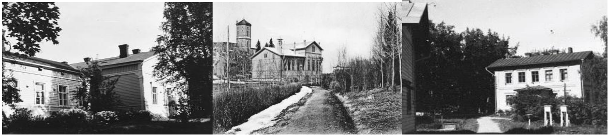
Sortavalan opettajaseminaarin naisopiskelijoiden asuntola 1939. Rakennuksia Kymölässä Seminaarin miesopiskelijoiden asuntola 1930-luvulla.