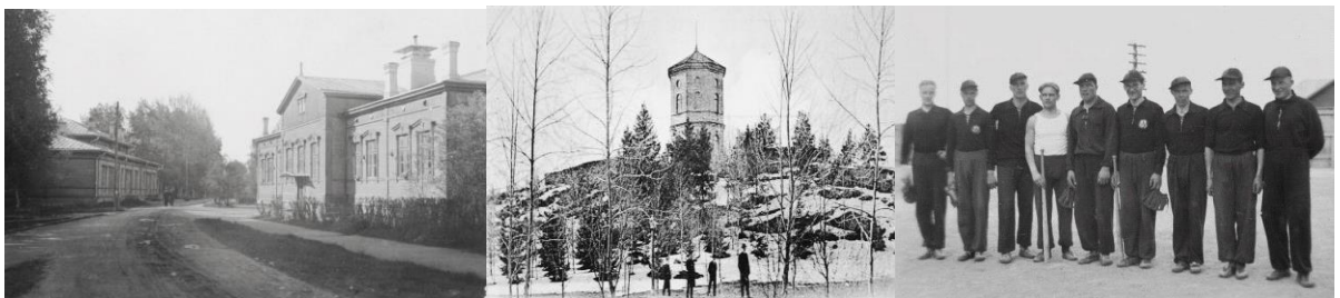
Seminaarin laululuokat ja poikaharjoituskoulu 1920-luvulla. Kymölän maisemia. Seminaarin pesäpallojoukkue 1930–1939.