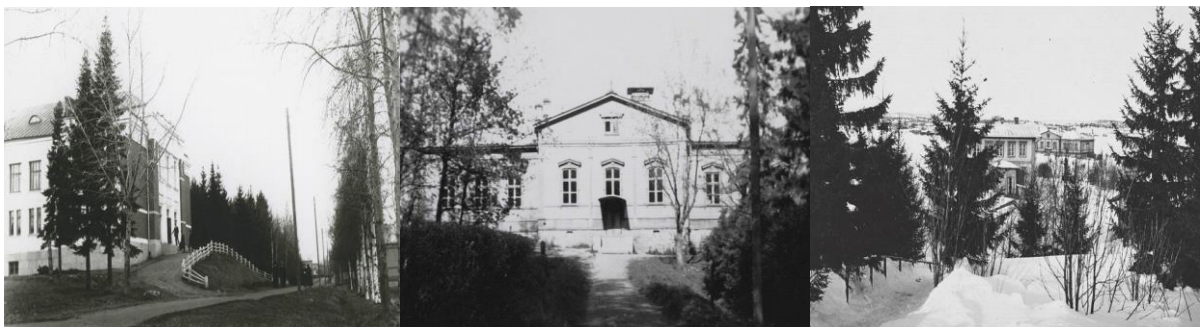
Sortavalan seminaarin juhlasalin rakennus 1912. Seminaarin miesluokat 1920–1939. Miesseminaari ja miesopiskelijoiden asuntola 1900-luvun alussa.