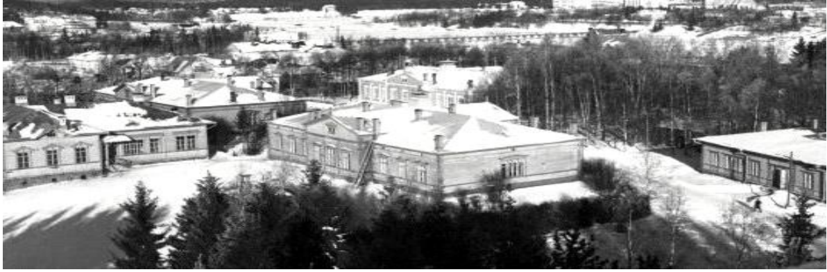
Sortavalan seminaarin rakennuksia ja aluetta 1920–1929 talviaikaan