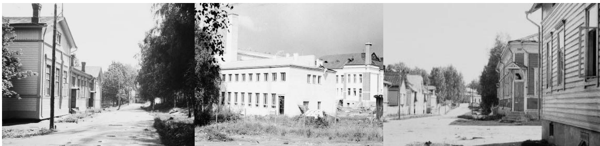
Sortavalan seminaarin voimistelusalin rakennus 13.4.1941 Sortavalan valtauksen jälkeen. Seminaarin juhlasalirakennus 13.8.1941 ollut venäläisten karsarmina, etualalla lisärakennus myös kasarmina. Kymölä vallattuna 13.8.1941. Seminaarikadun päässä laulusalirakennus, minkä vihollisen tykkituli poltti sitten 14.8.1941.