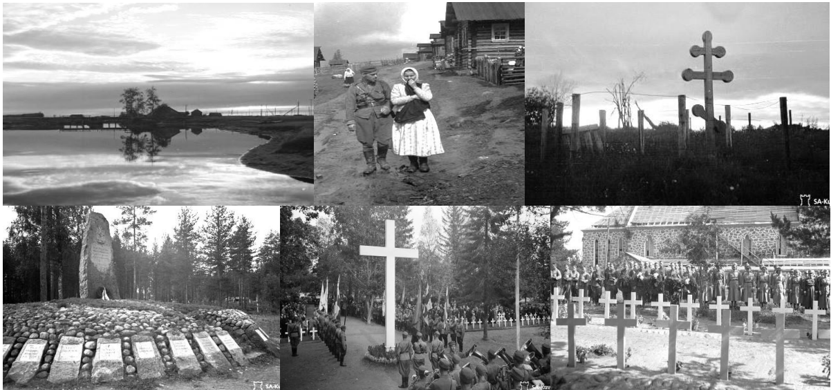
1. Aunus Jyrkilä 20.7.1942 Iltamaisema Märkjärven rannoilta: pato, saari ja mylly. Selki 25.6.1944 Itkijänainen kyynelehtien saattelee suomalaista sotilasta ennen lähtöä Karjalasta. Aunuksen risti 20.6.1944. 2. Aunuksen retken 31.8.1941, Sortavalan 15.8.1943 ja Käkisalmen 21.8.1942 muistomerkit ja sankarihaudat. Kesällä 1944 oli Karjalassa pitkät evakkojonot teiden varsilla. Sortavala luovutettiin 23.9.1944.