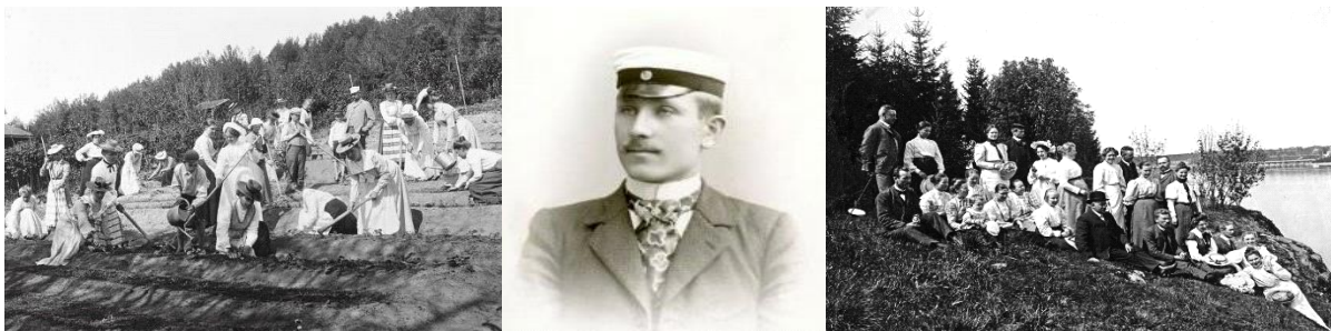
Muistoja menneistä oppivuosista: Kansakouluopettajia puutarhakursseilla seminaarilla 1899. Valmistunut opettaja 1902. Luokkakoukseen osallistuneita opettajia 1907.