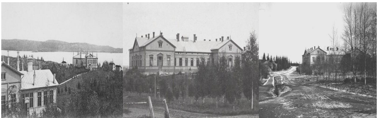
Seminaarin rakennuksia ja rantaseutua. Kuva: C.W. Alopeus 1900–1929. Sortavalan Seminaari 1892 Kuva: A. Aamio. Naisopiskelijoiden asuntola. n. 1900–1929. Kuva: Eemeli Kivirikko, museovirasto. finna.fi