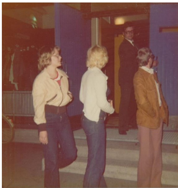
Opiskelijoita ravintola Ikituurin jonossa 1970-luvun puolivälin tienoilla