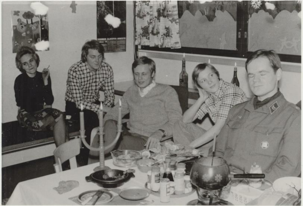
Ylioppilaskylä 1 D kerroksen joulupöytä vuonna 1974

Kasvatustieteen asema ja arvostus tieteissä nousi 1970-luvulla. Kansakouluja lakkautettiin ja Suomessa siirryttiin peruskoulujärjestelmään. Kasvatustieteiden tiedekunta perustettiin Turkuun vuonna 1974. Silloin myös kasvatustieteen maisterinimike otettiin käyttöön. Tutkimustyö kehittyi entisestään. Tavoiteoppiminen oli tärkeä opintoaihe. Asennetutkimukset olivat silloin ajankohtaisia opinäytetöitä ja monta asennetutkimusta julkaistiinkin. Faktorianalyysin tekemistä innokkaasti harjoitettiin ja reikäkortteja naputettiin. Kun itse oli tieteen tekemisessä vielä pieni, niin koneet olivat sitäkin suuremmat. Valmistaa saatiin kuitenkin ahkeralla työllä aikaan. Pienellä kirjoituskoneella valmiille kolmisivuiselle hiilipaperiarkille naputeltiin proseminaariryöt ja gradut.