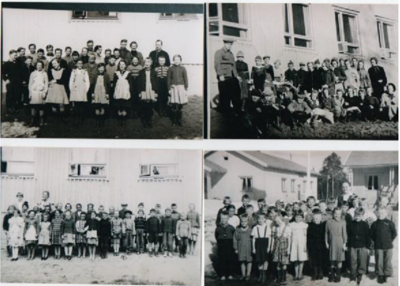
Vaadinselän kansakoulun luokkakuvia: ylhäällä vasemmalta yläluokkalaisia 1957, ylhäällä oikealla yläluokan 6–7 luokkalaisia 1958, alhaalla vasemmalla alaluokan oppilaita 1956, alhaalla oikealla alaluokan oppilaita 1955. Koulussa luokkahuoneet oli jaettu niin, että alaluokka oli 1–3, yläluokka 4–7.