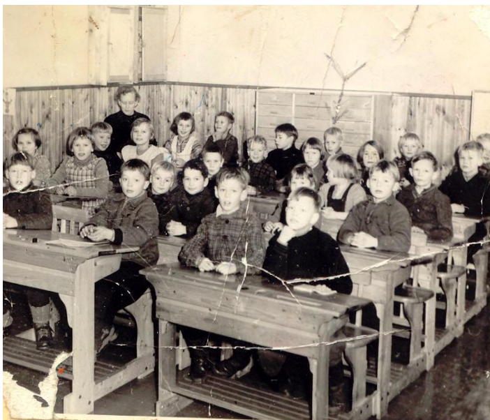
Vaadinselän kansakoulun alaluokkalaisia vuoden 1954 keväältä.

Ensimmäinen koulupäiväni Vaadinselän kansa-koulussa alkoi alkusyksyn kuulakkaan tiistaipäivän aamuna 1.9.1953. Lauantaitkin olivat vielä silloin koulupäiviä. Koulumatka oli 7 kilometriä. Koulussa oli kaksi luokahuonetta, alaluokka luokille 1–3 ja yläluokka luokille 4–7. Kylällä ja koululla ei ollut vielä sähköjä. Hasakin tai öljylampun valossa oltiin talvisin luokassa ja asuntolan tiloissa. Käytävässä oli höyläpenkit poikien veistotunnille. Tyttöjen käsityötunti pidettiin luokassa. Askartelua voitiin tehdä yhdessä koko luokan kanssa. Esimerkiksi tehtiin vanhoista korteista käteviä koreja neulomalla sivut kiinni ja kuusisivuisen alaosan päälle. Ne olivat hienoja, ne ovat jääneet alaluokilta muistoon. Jalkapallo- ja pesäpallokenttä oli tien laidassa. Voimistelutunti pidettiin asuntolassa poikien huoneessa tai käytävässä. Palloleikkejä leikittiin usein myös pihalla.