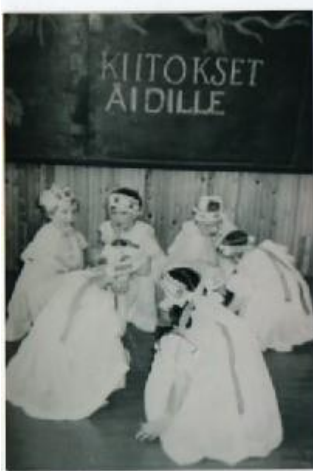
Kevätleikkejä Vaadinselän koululla.

Illalla käytiin 2–3 ryhmässä hakemassa Alapeteristä maitotonkka. Talvella maitoa haettiin kelkalla, muulloin kottikärryn tapaisella. Opettaja ei tykännyt siitä, että pojat metsästä hakivat ja löysivätkin vanhaa sota-ajan rompetta. Pojat olivat löytäneet sieltä sotilaan jäänteetkin ja kypärän, onneksi ei miinoja. Koulun lammen ympäristö oli jännittävä paikka. Asuntola-aikanakin sai juosta metsissä, sitä ei vartioitu eikä kielletty. Vahinkoja ei kumma kyllä koskaan suuremmin sattunut. Mitä nyt kesälomalla, kun pojat menivät kanahaukan pesälle ja emo tuli ja iski kyntensä kiipeilijän niskaan. Haavoihin keitettiin sitten tehokasta pihkavoidetta ja ne paranivat. Pojilla kun oli elättinä Pekka-korppi ja ”pikkulintuja” eli kanahaukan poikasia, joille piti sitten pyydystää sammakoita ja muuta syötettävää. Oli siinä kesäpäivinä jängällä ja metsässä juoksemista. Ja täytyi seurata muittenkin lintujen elämää, Olli-tikkaa lähikelossa ja pikkuista Pikku piika pajulinnun pesää vanhassa posti-laatikossa. Myös hillankukkien määrää ja paikkaa tuli tarkistaa ja muuta marjasatoa. Aamuisin lehmät ajettiin metsään tai aavalle, haettiin sitten iltaisin pois ja päivällä niille lehtiä riivittiin. Pojat kalastelivat usein Majavalammella lautan päällä ahvenia ja puroista saivat välillä tammukoitakin. Tarvittiin myös lierojakin matopurkkiin syötiksi kivien alta kerätä. Koskaan ei kuultu lasten sanovan, ettei ole mitään tekemistä.