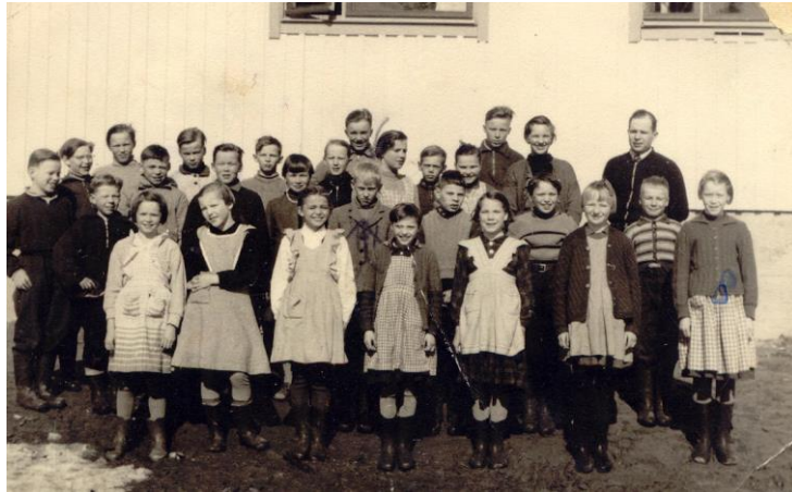
Vaadinselän kansakoulun yläluokka 1957.

Meillä tytöillä oli talvella enemmän potkukelkka käytössä. Luistimia ei silloin meillä ollut, mutta hiihtäminen oli tavallista. Kesällä sitten pyöräiltiin. Ja usein miesten pyörillä tangon välistä. Kumit olivat usein rikki, kun oli huonot tiet. Pyörällä käytiin koulun lammella lämpiminä kesäpäivinä uimassa. Kämpän lampi oli pohjaton, sinne eivät lapset voineet mennä. Majavalampi oli kaukana rämeikön takana. Kesäaitassa nukuttiin ja uni oli syvää. Pojat ottivat aittaan aina ruislimpun, rapuskaa, monta litraa maitoa ja kokonaisen pitkän pullapitkon. Sunnuntaisin tavallisesti kyläiltiin kävellen tai pyöräilemällä. Silloin oli pyhävaatteet päällä, kahviteltiin ja syötiin pullaa ja torttuja.