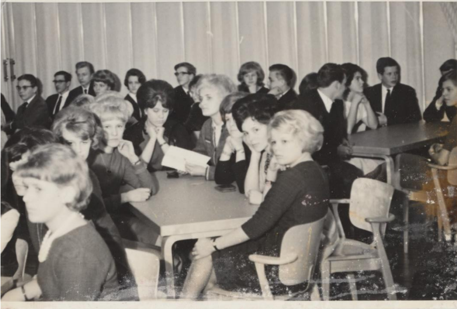
Juhlayleisöä lyseon eräästä juhlatilaisuudesta 1960-luvulta