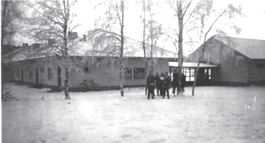
Oman luokkani, yhdistetyn VI-VII-luokan oppilaita välitunnilla. Opettajan tuli näissä oloissa toimia oman luokkansa valvojana jokaisella välitunnilla.